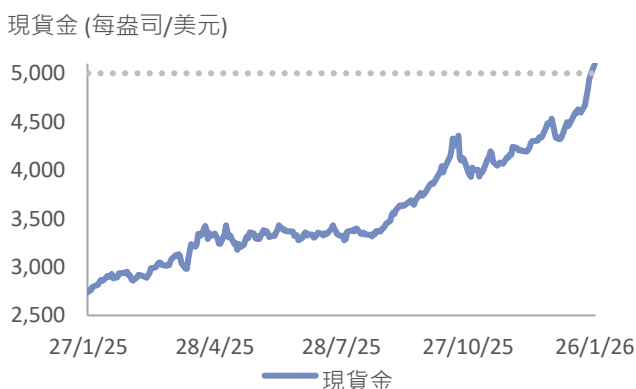
圖二：現貨金價屢創新高