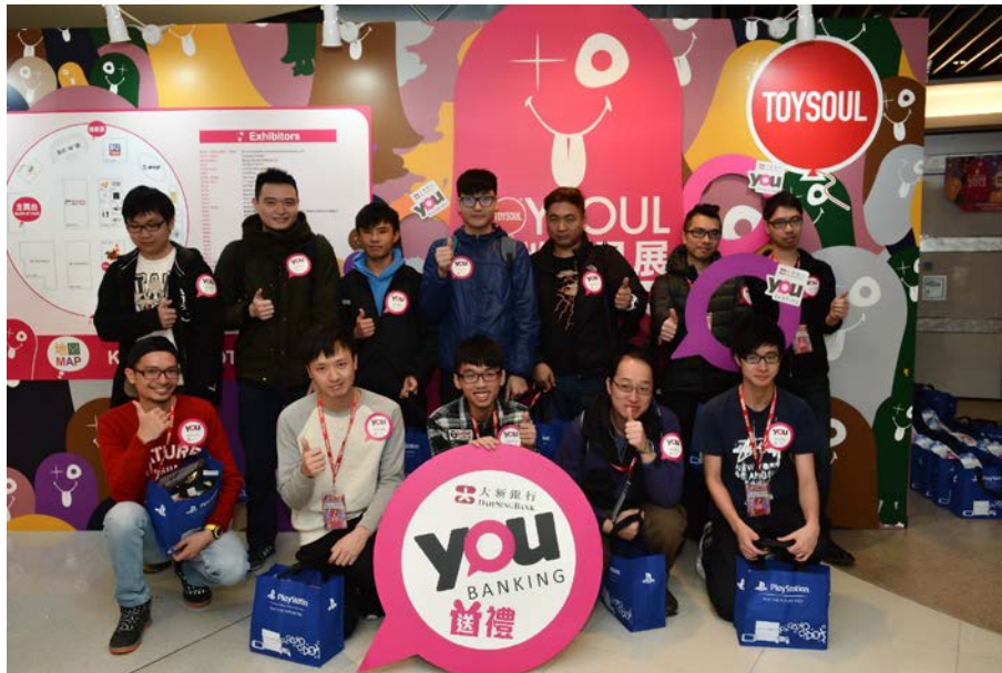
附圖 1：大新 YOU Banking 全力支持 TOYSOUL 2015「第二屆亞洲玩具展」，並特別為 Facebook 專頁粉絲獨家安排參加「優先預覽團」，優先參觀玩具展，快人一步率先欣賞不同玩具界新品及各款潮流玩意。