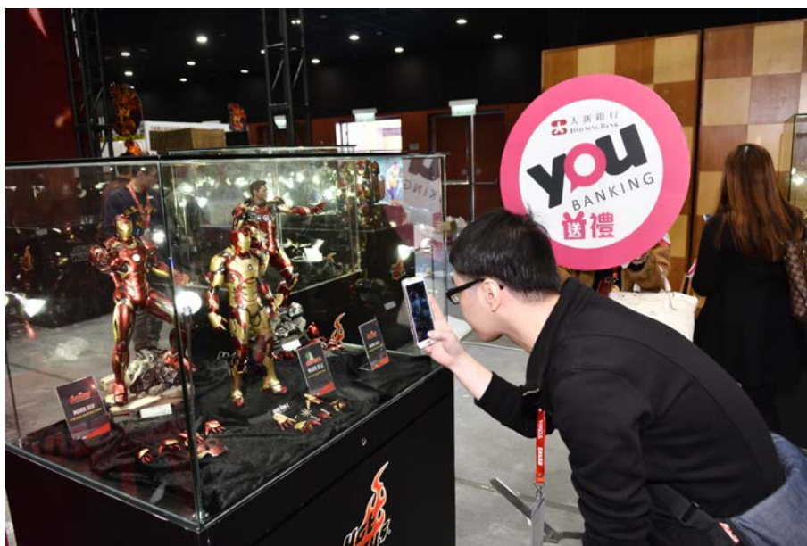
附圖 2：大新 YOU Banking「優先預覽團」是特別為大新銀行 Facebook 專頁粉絲加開的特別參觀時段，避開了正場展覽時段的人潮。在團長帶領下各位粉絲輕鬆遊走各玩具展覽攤位，並可細心欣賞及研究各款玩具創作及潮流玩物等。