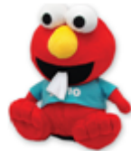
Elmo毛公仔紙巾套乙個