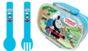
Thomas & Friends™精美午餐盒套裝乙套

註：有關以上優惠詳情、迎新禮品和條款及細則，請瀏覽 www.dahsing.com 。