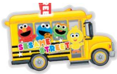
「芝麻街」八達通卡套乙個

新客戶只需由即日起至2014年6月30日到任何一間大新銀行分行以HK$5,000開立卡通人物儲蓄戶口並維持該金額於戶口內達一個月，即可獲贈精美迎新禮品乙件。