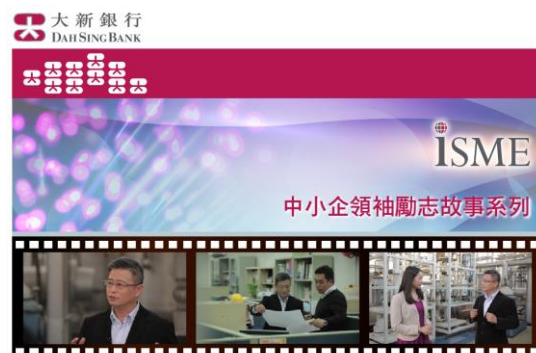
圖二及三：「iSME」網上銀行服務平台及「中小企領袖勵志故事系列」